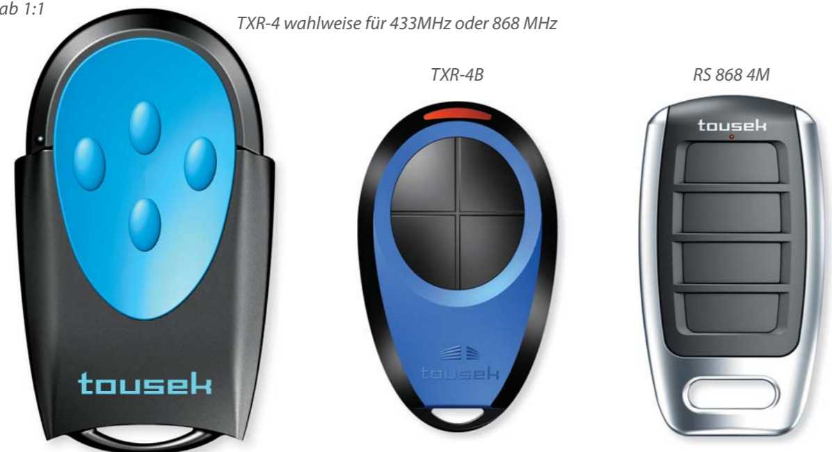
TXR-4 wahlweise für 433MHz oder 868 MHz