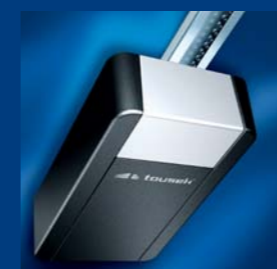
tousek Garagentorantriebe sparsam und schnell