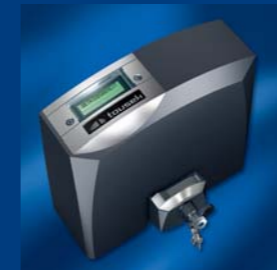
tousek Schiebetorantriebe kompakt und sicher

Ausführung, Zusammenstellung, technische Veränderungen sowie Satz- und Druckfehler vorbehalten. Alle Inhalte sind Urheberrechtlich geschützt. Nachdruck, digitale Vervielfältigung, auch auszugsweise, nur mit unserer schriftlichen Genehmigung.