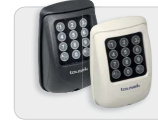
in schwarz oder weiss