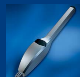
tousek Drehtorantriebe massiv und zuverlässig