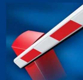
tousek Schrankensysteme formschön und robust