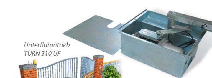
Unterflurtrieb TURN 310 UF