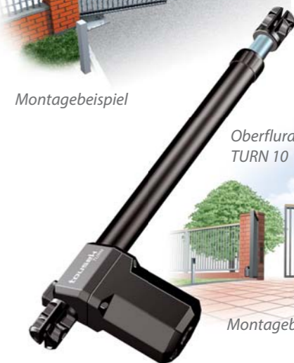
Oberflurtrieb TURN 10