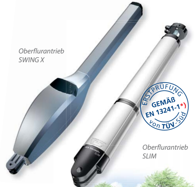
Oberflurtrieb SWING X