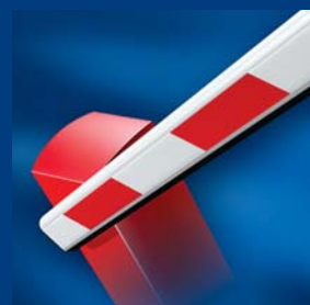
závorové systémy tousek robustní a tvarově dokonalé