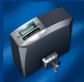
pohony posuvných bran tousek kompaktní a stabilní

Technické změny, tiskové chyby a chyby v sazbě vyhrazeny. Veškerý obsah je chráněn autorským právem. Tisk, digitální rozmnožování, a to i částečné, pouze s naším písemným svolením.