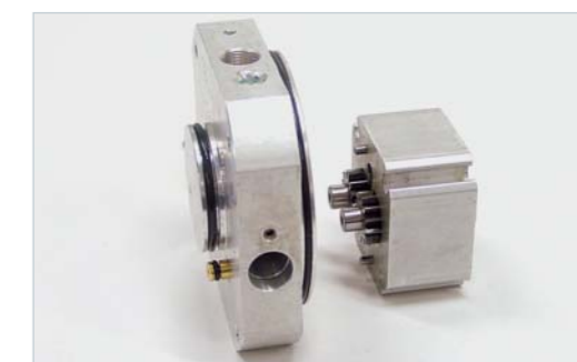
Hydraulické čerpadla pohonů Swing se vyznačují obzvláště tichým chodem.

Speciální blokovací ventily aretují bránu v obou koncových polohách. Proti přehřátí chrání integrovaná termopojistka.