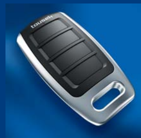
program dálkového ovládání tousek kompatibilní a bezpečný