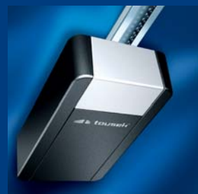
pohony garážových vrat tousek úsporné a rychlé